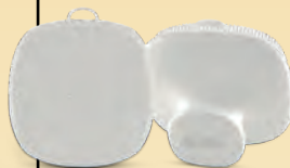
Silikonskom četkicom za čišćenje