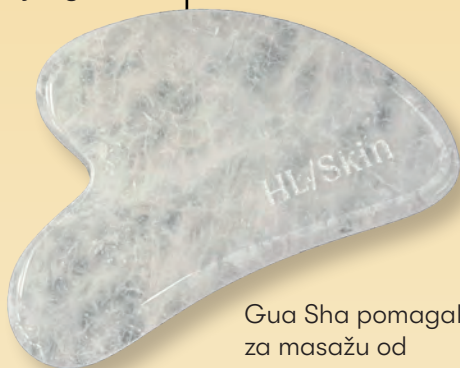
Gua Sha pomagalo za masažu od bijelog žada

Nježno umasirajte u svoju kožu pomoću našeg Gua Sha pomagala za masažu od bijelog žada.