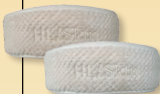
Pamučnom trakom za glavu